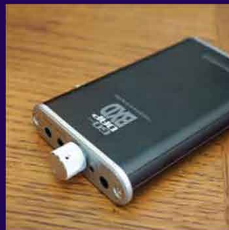
@旺角星際城市分店 KATIE