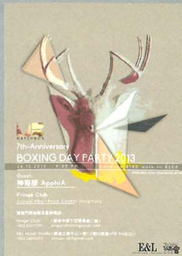
▲ Matchbox 7th Anniversary Boxing Day Party 2013