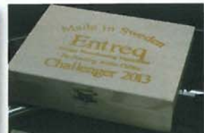
· 木盒包裝，既高貴又有原始風味。