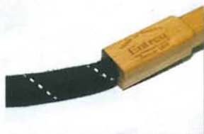
· Entreq 喜歡使用棉布、木材等天然物料製作線材。