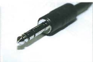
· 6.3mm 插頭為 Cardas 出品的鍍金、鍍銻製品。