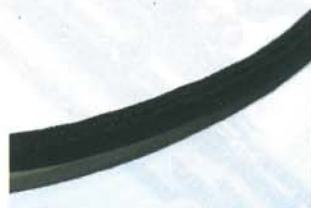
· 外層屏蔽為聚酯纖維編織物。