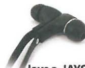
Jays a-JAYS Five